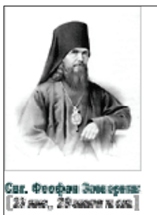
Свт. Феофан Затворник (23 янв., 29 апреля н. ст.)

(Еф. 6, 10-17; Лк. 13, 10-17). В праздник Введения во храм Пресвятой Богородицы начинают петь: "Христос рождается", готовя верующих к достойному сретению праздника Рождества Христова. Поняв это внушение и действуй по нему. Углубись в таинство воплощения Единородного Сына Божия, взойди до начала его в предвечном совете Божием о бытии мира и человека в нем, усмотри отражение его в сотворении человека, радостно встреть первое о нем благовестие тотчас по падении, проследи разумно постепенное его раскрытие в пророчествах и прообразах ветхозаветных; уясни, кто и как приготовился к принятию воплощенного Бога, под влиянием Божественных воспитательных учреждений и действий, среди Израиля, - перейди, если хочешь, за пределы народа Божия, и там собери лучи света Божия, во тьме светящегося, - и сообрази, насколько избранные от всех народов дошли до предчувствия необыкновенного проявления Божеского смотрения о людях. Это будет мысленное приготовление. Но тут пост: соберись же поговеть, исповедуйся и причастись св. Христовых таин: это будет приготовление деятельное и жизненное. Если, вследствие всего этого, даст тебе Господь ощутить силу пришествия Своего во плоти - то, когда придет праздник, ты будешь праздновать его не из-за чуждой тебе радости, а из-за своей кровной.